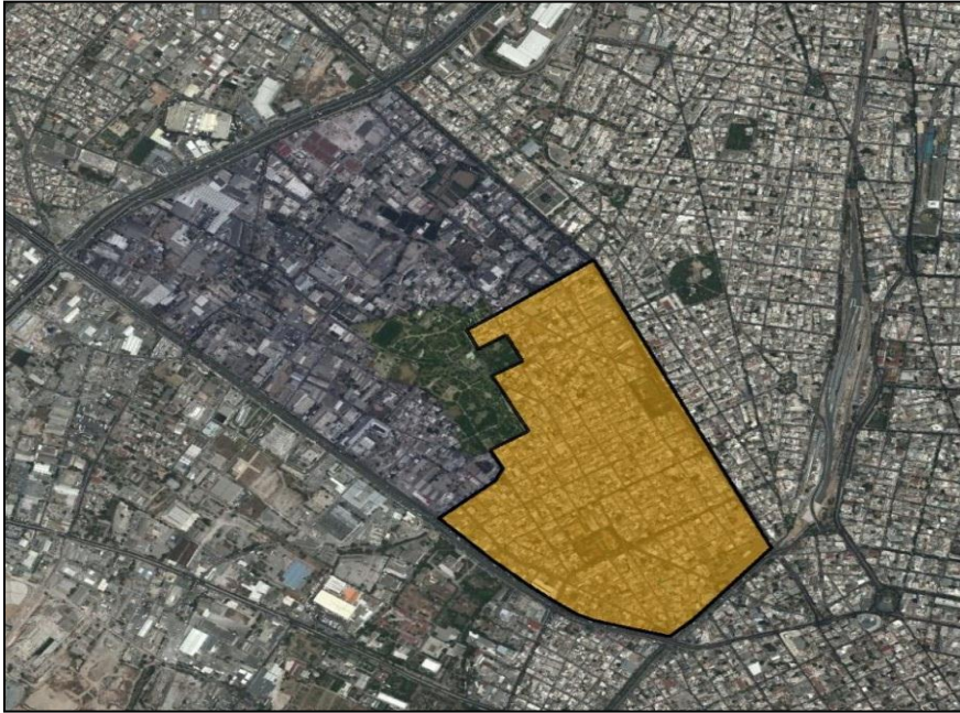
περιοχή κατοικίας