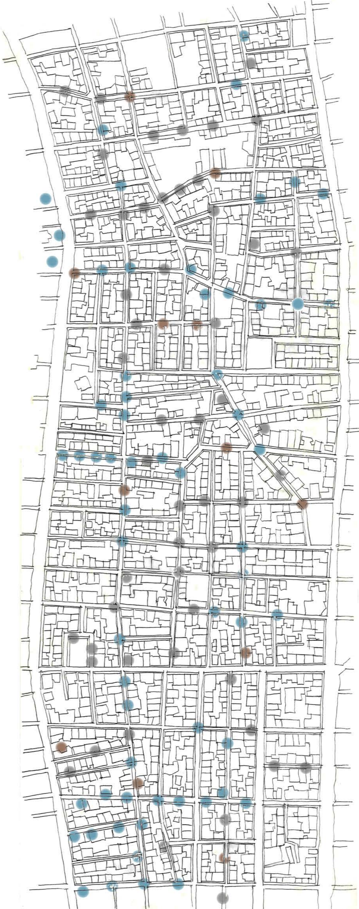
● Συνθήματα ρατσιστικού περιεχομένου ● Συνθήματα μη ρατσιστικού περιεχομένου ● Γκράφιτι μη πολιτικού περιεχομένου ΚΛΙΚΑΜΑ 1:5000

Από την άλλη μεριά επιδιώκουμε να προκαλέσουμε τα ίδια τα υποκείμενα να γίνουν οι φορείς υλοποίησης αυτού του σεναρίου. Στόχος είναι να δημιουργηθούν προϋποθέσεις χρήσης της επιφάνειας στο δημόσιο χώρο με ένα διαλλακτικό τρόπο, που όμως θα αποκλείει, θα αποτρέπει, θα απομονώνει και τελικά θα μετατοπίζει αυτόν που εκφράζεται με το μίσος, που επιδιώκει τον κοινωνικό αποκλεισμό και κανιβαλισμό, αυτόν που δε σέβεται τα στοιχειώδη ανθρώπινα δικαιώματα.