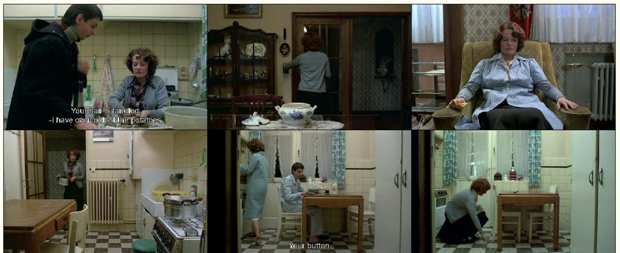
Οι ρωγμές στην καθημερινότητα της Dielman

Έχοντας βυθιστεί σε αυτήν την αδιάκοπη ροή της κανονικότητας της Jeanne Dielman, αρχίζουμε μετά το μισό της ταινίας να παρατηρούμε τις ρωγμές που διαφαίνονται στη μέχρι τότε μηχανιστικά ρυθμιζόμενη καθημερινότητά της. Οι θεατές αρχίζουν να παρατηρούν λεπτομέρειες που η Jeanne δεν εκτελεί πια με όρους μηχανής. Αποσυντονιζόμαστε όταν της πέφτουν πράγματα, όταν παραψήνει τις πατάτες, όταν πηγαινοέρχεται αμήχανα στο χώρο· σχεδόν ενοχλούμαστε όταν δεν κλείνει το βάζο όπως έκανε παλιότερα ή που ένα κουμπί της ρόμπας της είναι εκτός κουμπότρυπας. Μια κατσαρόλα που την πηγαινοφέρει αφηρημένα και άσκοπα στα δωμάτια του σπιτιού, δημιουργεί αμφιβολίες για το ρόλο της ηρωίδας ως δρών υποκείμενο. Την αντιλαμβανόμαστε ξεκάθαρα πλέον περισσότερο ως αντικείμενο παρά ως υποκείμενο των συγκροτητικών πράξεων που έχει υιοθετήσει στο πλαίσιο ενός ευρύτερου φαντασιακού της έμφυλης ταυτότητάς της. Οι εικόνες που την δείχνουν αποβλακωμένη στον καναπέ, ακολουθούνται από εκδηλώσεις πανικού, όπου η Jeanne μπαινοβγαίνει στο σπίτι της, (βρίσκοντας διάφορες προφάσεις που συνάδουν με τις κανονιστικές επιταγές του φύλου της), προσπαθώντας να ορίσει τα όρια της χωρικής της ταυτότητας μεταξύ ιδιωτικής και δημόσιας σφαίρας.