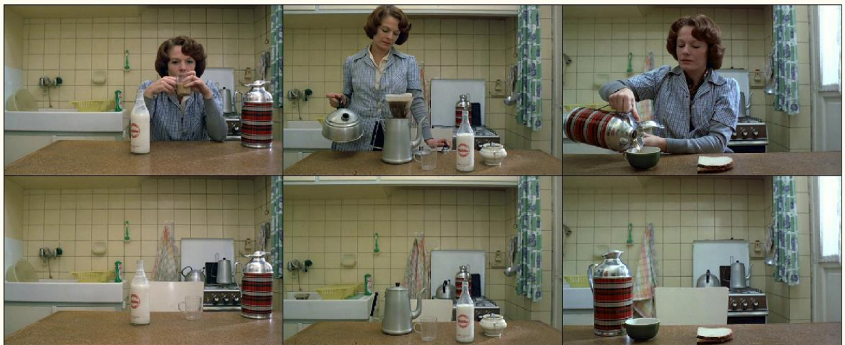
Θεωρώντας το υποκείμενο ως αντικείμενο των συγκροτητικών του πράξεων

κοπιώδεις διαδικασίες που υλικοποιούν το «φύλο» και το ορίζουν ως κοινωνικά κατασκευασμένο φαντασιακό «μέσω μιας βίαιης επανεπιβεβαίωσης κανονιστικών προτύπων» 24 . Οι ρωγμές που διαρρηγνύουν τη συγκροτημένη έμφυλη ταυτότητα της ηρωίδας στο δεύτερο μισό της ταινίας, αποδεικνύουν (αφαιρετικά) ότι αυτή η επανεπιβεβαίωση στην ουσία είναι αναγκαία γιατί τα υποκείμενα δεν μπορούν να συμμορφωθούν πλήρως στα κανονιστικά πρότυπα που τους επιβάλλονται. Όπως χαρακτηριστικά αναφέρει η Butler: «...δυνάμει αυτής της επανεπιβεβαίωσης διανοίγονται χάσματα και ρωγμές ως καταστατικές αστάθειες σε τέτοιες κατασκευές, (...) όπως εκείνη που δεν μπορεί να οριστεί ή να παγιωθεί πλήρως από το επαναλαμβανόμενο έργο αυτού του κανονιστικού προτύπου. Αυτή η αστάθεια είναι η πιθανότητα από-συγκρότησης στην ίδια τη διαδικασία της επανάληψης...» 25 . Ωστόσο, τα έμφυλα υποκείμενα που δεν συμμορφώνονται σε αυτές τις κανονιστικές προσταγές πραγμάτωσης του φύλου τους όχι μόνο τιμωρούνται, αλλά αποτελούν και αυτό το καταστατικό «εκτός» που είναι απαραίτητο για την ισχυροποίηση και την επικράτηση του κανονιστικού προτύπου.