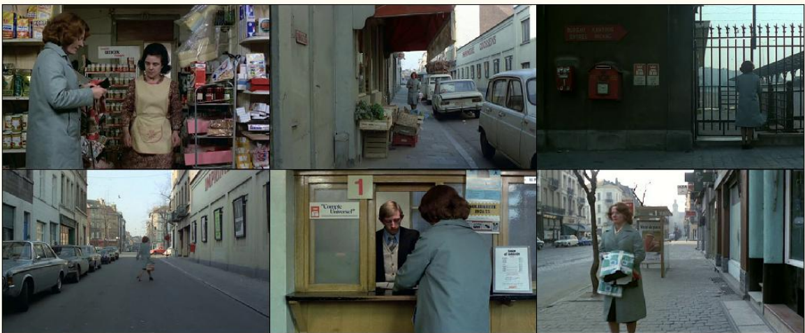
Εικόνες της Jeanne στο σκηνικό της πόλης

Πώς όμως αυτές οι παραστασιακές επιτελέσεις της Jeanne Dielman, όπως τις περιγράψαμε παραπάνω, παράγουν συγκεκριμένες έμφυλες χωρικές; Μέσα από αυτή τη διαδικασία συγκρότησης της έμφυλης ταυτότητάς της, μπορούμε να αντιληφθούμε και το χώρο ως μια κοινωνική κατασκευή παραγόμενη από μια σειρά επιτελεστικών διαδικασιών μέσα στο χρόνο. Οι έννοιες του χρόνου και του χώρου άλλωστε, είναι κυρίαρχες στην ταινία: ο βασανιστικός χρόνος (που παραπάνω ταυτίστηκε με την ζήματοποίηση της έμφυλης κανονικότητας) εκτέλεσης των καθηκόντων της ηρωίδας, που συντελούνται στον ασφυκτικό και κλειστοφοβικό χώρο της ιδιωτικής της σφαίρας. Πλάι στο «μοντέλο ταυτότητας που στηρίζεται στην έννοια της συγκροτημένης χρονικότητας» 26 της Butler, πρέπει να προσθέσουμε ότι το μοντέλο αυτό έχει και συγκεκριμένες δυνατότητες χωρικότητας, που κατασκευάζουν εν πολλοίς τα όρια του δίπολου δημόσιο-ιδιωτικό.