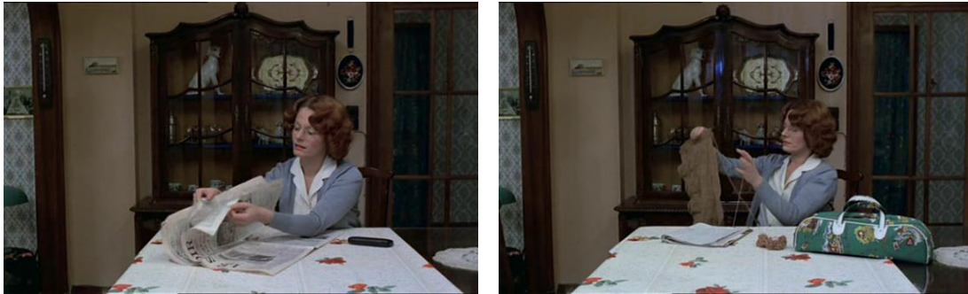
Το φευγαλέο ξεφύλλισμα της εφημερίδας το διαδέχεται το πλέξιμο