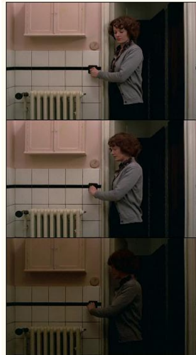
Τα όρια της δικής της πόλης