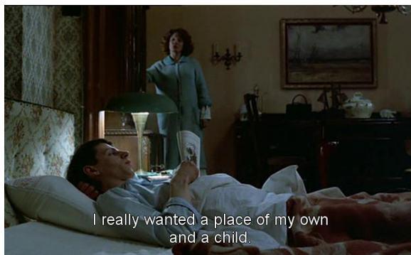
“Ήθελα πραγματικά ένα δικό μου χώρο και ένα παιδί”

Στο γράμμα της η Fernande, η αδερφή της Jeanne που μένει στον Καναδά, αναφέρει πως λόγω των μεγάλων αποστάσεων στην πόλη που ζει, όλες οι γυναίκες ξέρουν να οδηγούν προκειμένου να μην μένουν αποκλεισμένες στο σπίτι. Ο σύζυγός της την παρακινεί να μάθει οδήγηση λέγοντας της πως «πρέπει να υιοθετήσει τους κανόνες αυτής της πόλης». Μειδιούμε όταν πολύ παρακάτω στην ταινία η Jeanne που σχεδόν εμμονικά και ανεπιτυχώς ψάχνει να αντικαταστήσει το κουμπί ενός παλιού παλτού - δώρου της Fernande-, αναφέρει: «λένε πως η Ευρώπη είναι πέντε χρόνια πίσω από την Αμερική, για αυτό είχα ακόμα ελπίδα». Το γεγονός ότι αποτελούν τις μοναδικές αναφορές στη Fernande, μέσα στους λιγοστούς διαλόγους της ταινίας, δείχνει ότι μάλλον έχουν κάποια σύνδεση. Παρακάτω, σε άλλη σκηνή ο γιος της Jeanne την ρωτάει γιατί παντρεύτηκε, και αυτή αποκρίνεται ότι «ήθελε πολύ το δικό της χώρο και ένα παιδί».