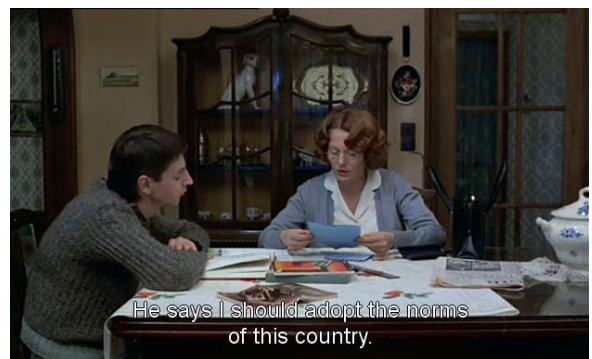
“Λέει ότι πρέπει να υιοθετήσω τους κανόνες αυτής της πόλης”

Από τις παραπάνω αναφορές αντιλαμβανόμαστε πως η σχέση του δημόσιου χώρου με τον ιδιωτικό προσδιορίζεται με διαφορετικά συμφραζόμενα για τις δύο γυναίκες που κατοικούν σε διαφορετικές πόλεις. Τα πρότυπα και η μορφή της πόλης στην οποία κατοικεί η Fernande την παρακινούν να αναζητήσει τρόπους διαφυγής από την αποκλεισμένη ιδιωτική της σφαίρα, υιοθετώντας τη νόρμα που έχει καθιερωθεί για τη γυναίκα στη δεδομένη κοινωνική δομή. Με αυτόν τον τρόπο συγκροτείται μια διαφορετική χωρική ταυτότητα από εκείνη της Jeanne που παραμένει εγκλωβισμένη