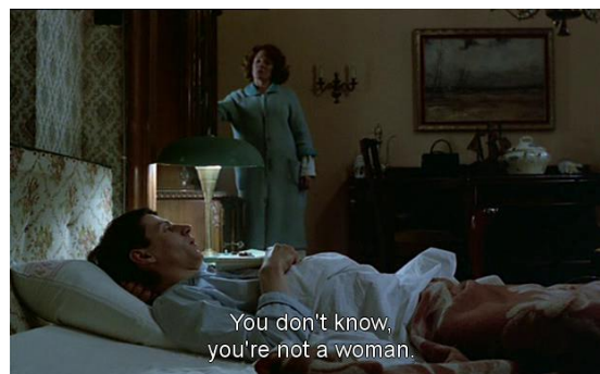
Jeanne: 'Δεν ξέρεις, δεν είσαι γυναίκα.'

Αντί επιλόγου παραθέτω το ποίημα του Charles Baudelaire που επαναλαμβάνεται δύο φορές στην ταινία καθώς η Jeanne βοηθάει το γιο της στα μαθήματα.