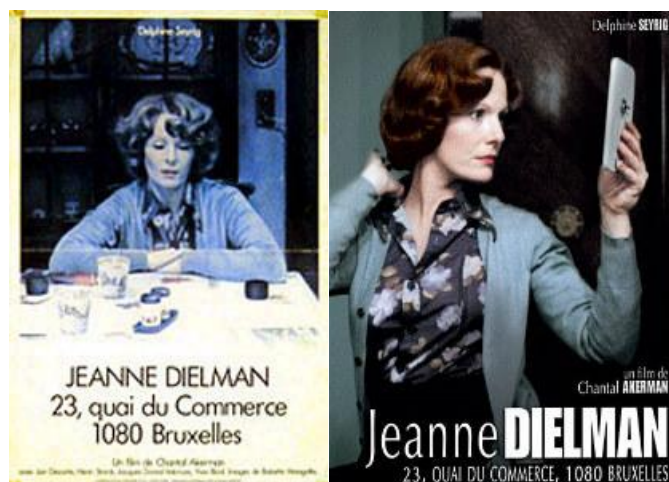
Posters από την ταινία