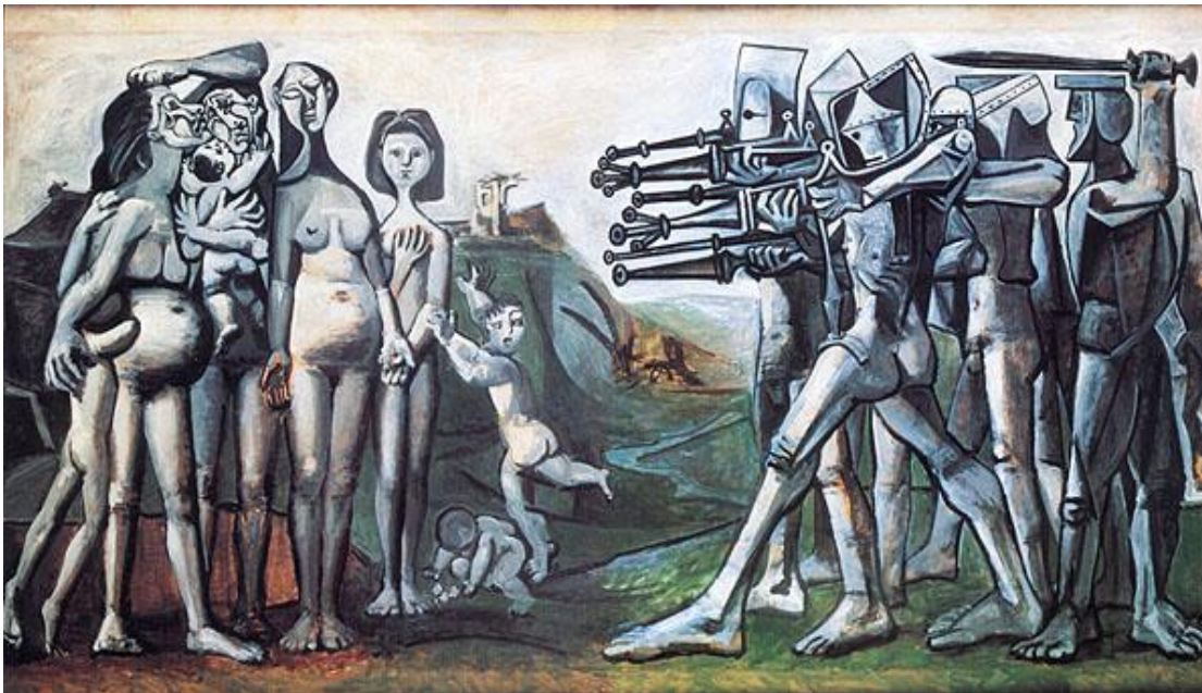
Pablo Picasso's 'Massacre in Korea' (1951; in the Musée Picasso, Paris)