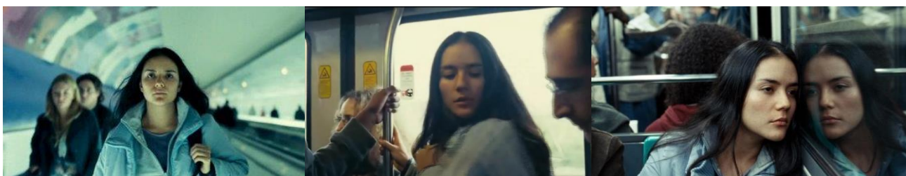
Το καθημερινό ταξίδι