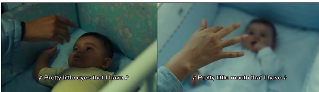
Το τραγούδι- νανούρισμα

Τι χαριτωμένα πατουσάκια που έχω εγώ, Που τόσο όμορφα και στρουμπουλά μου τα έδωσε ο Θεός.