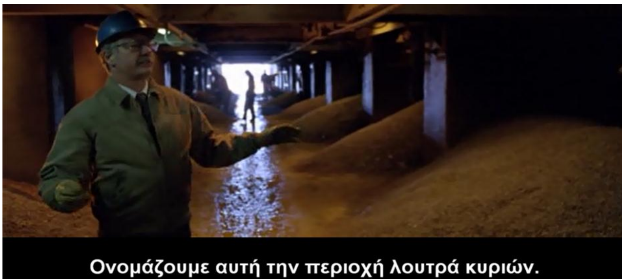
Ονομάζουμε αυτή την περιοχή λουτρά κυριών.

Ο χώρος δουλειάς των γυναικών στο εσωτερικό του μεταλλείου, είναι ένας μεγάλος υπόγειος χώρος, με ορυκτό σιδήρου, που οι εργαζόμενοι άνδρες τον αποκαλούν «Τα λουτρά των κυριών», και ο ρόλος των εργαζόμενων γυναικών εκεί είναι η καθαριότητά του. Υπεύθυνος για το χώρο είναι ένας άνδρας εργαζόμενος, από τους πρωτεργάτες των έμφυλων επιθέσεων στο μεταλλείο. Ο χώρος αυτός είναι απόμερος και σκοτεινός, κάτι που έπαιξε ρόλο στην επιλογή της σκηνοθεσίας να γίνει σε αυτόν η βασική σεξουαλική κακοποίηση της πρωταγωνίστριας. Η «ιδιωτικότητα», που προσέφερε στους άνδρες εργαζόμενους για τις επιθέσεις, αυτή τη φορά διακατέχεται από τη χείριστη έννοια του όρου, και είχε σαν αποτέλεσμα οι οποιοσδήποτε καταγγελίες εκ μέρους των γυναικών να μη γίνουν πιστευτές.