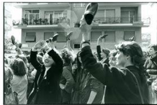
Εικόνες από διαδηλώσεις γυναικών τη δεκαετία του 1970 στην Ιταλία.