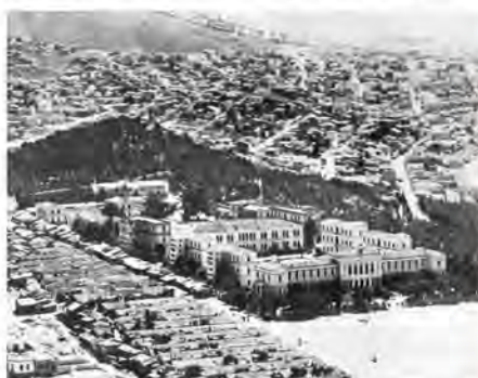
Ο προσηγορικός συνοικισμός στη σημερινή οδό Ευελπίδων, σε φωτογραφία του 1940. Από το «Οδογραφικό της Κυψέλης στις δεκαετίες '50 και '60» του Α. Βαβαγιάννη.

Η ομάδα γεννήθηκε πριν από ακριβώς ένα χρόνο. Αφορμή στάθηκε μια σειρά ανοικτών σεμιναριακών μαθημάτων που αποσκοπούσαν στην εξοκείωση εθελοντών με τη μεθοδολογία της Προφορικής Ιστορίας. Τριάντα εθελοντές, άγνωστοι οι περισσότεροι μεταξύ τους, παρακολούθησαν έξι τριώρα μαθήματα (από την ιστορικό Τασούλα Βερβενιώτη, την κοινωνική ανθρωπολόγο Ρίκα βαν Μπουσάχτεν και την ιστορικό Ληδα Παπαστεφανάνη) σε αίθουσα με τον απαραίτητο τεχνολογικό εξοπλισμό (ηλεκτρονική, βιντεοπροβολέα κ.λπ.) που παρακάλεσε το Εθνικό Μετσόβιο Πολυτεχνείο. Όταν ολοκληρώθηκαν τα μαθήματα οι εθελοντές, κάτοικοι Κυψέλης οι περισσότεροι, αλλά και μεταπτυχιακοί φοιτητές από το Πάντειο Πανεπιστήμιο και το ΕΜΠ, ανέλαβαν την υποχρέωση. Η επιτυχία του σεμιναρίου οδήγησε στο επόμενο βήμα που ήταν η συγκρότηση της ίδιας της ομάδας με δική της ιστοσελίδα ( https://sites.google.com/site/orpikdomain ) και τριών θεματικών υποομομάδων που στελεχώνονται σήμερα από 20 εθελοντές: δεκαετία '40, καθημερινή ζωή από τον Μεσοπολέμο και μετά και μεταναστευτική. Παρά το γεγονός ό-