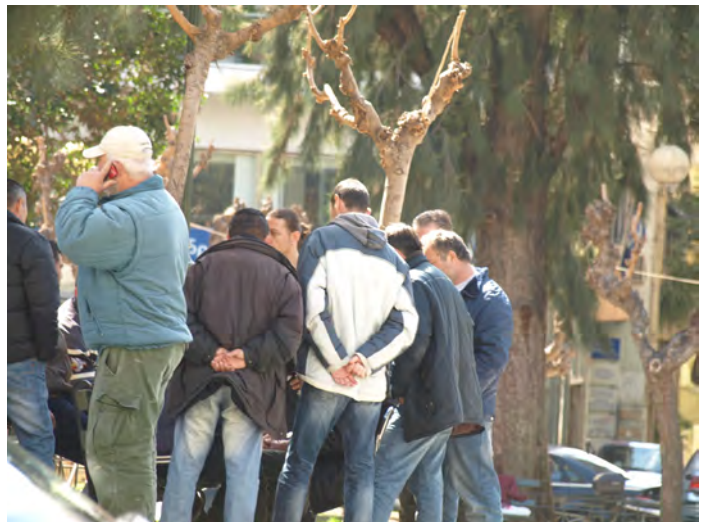
Πλατεία Κανάρη - Κυψέλης