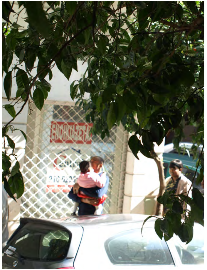
Γενικές εικόνες από την Κυψέλη