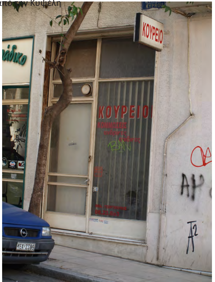
Γενικές εικόνες από την Κυψέλη