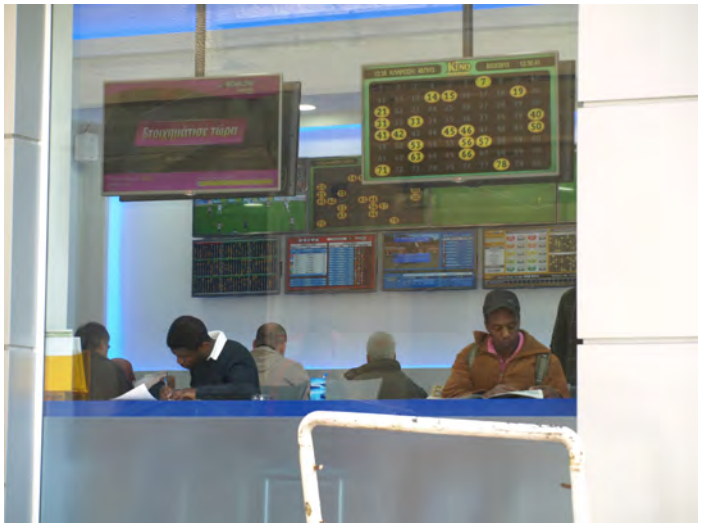
Γενικές εικόνες από την Κυψέλη