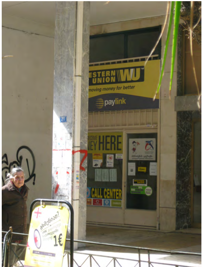
Πεζόδρομος Αγίας Ζώνης