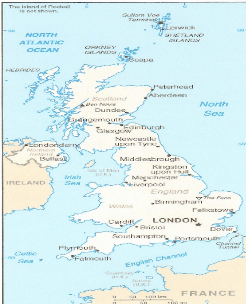
Χάρτης Ηνωμένου Βασιλείου

Το Ηνωμένο Βασίλειο (United Kingdom), είναι μια συνταγματική μοναρχία. Αποτελείται από τέσσερα έθνη: την Μεγάλη Βρετανία (Αγγλία, Ουαλία, Σκωτία) και την Βόρεια Ιρλανδία. Χαρακτηρίζεται ως «Ηνωμένο Βασίλειο» και αυτό οφείλεται στον τρόπο με τον οποίο αναπτύχθηκε ιστορικά, αφού προήλθε από την ένωση περισσότερων εθνών η οποία συνέβη με την πάροδο των ετών και του έδωσε την σημερινή του μορφή (Καρβούνης, 2003).