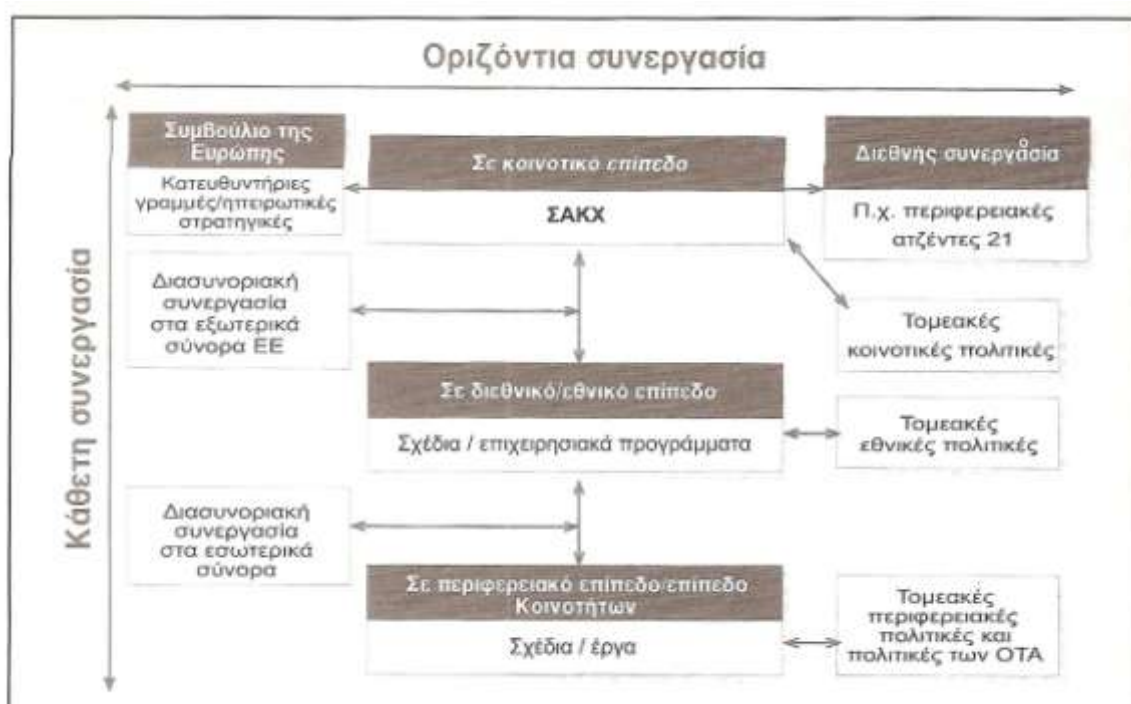
Εικόνα 3: Κάθετη και Οριζόντια Συνεργασία με στόχο τη Χωρική Ανάπτυξη.