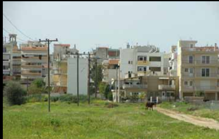
Προσεγγίσεις του Εφαρμοσμένου Αστικού Σχεδιασμού στην Ελλάδα - Δήμος Αχαρνών

Εθνικό Μετσόβιο Πολυτεχνείο // Σχολή Αρχιτεκτόνων Μηχανικών // ΔΠΜΣ: Αρχιτεκτονική - Σχεδιασμός του Χώρου // Κατεύθυνση Β': Πολεοδομία - Χωροταξία