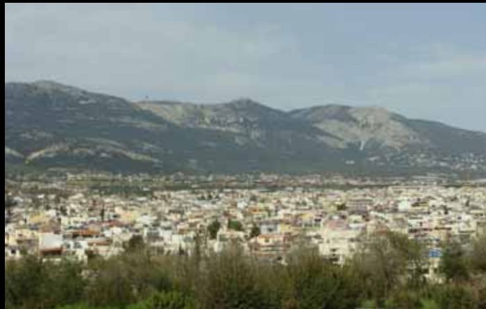
Εγγύτητα ορεινού όγκου Πάρνηθας