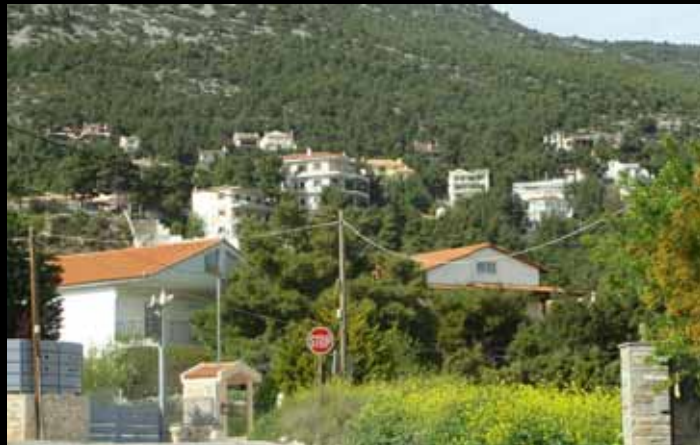
Δόμηση αυθαίρετων κατοικιών σε δασικές εκτάσεις