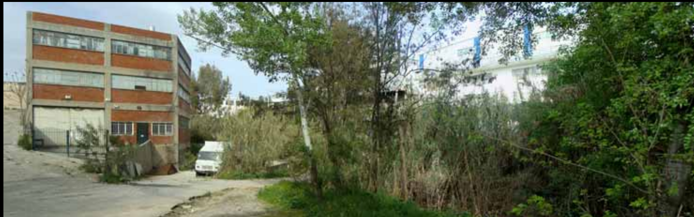
Προσεγγίσεις του Εφαρμοσμένου Αστικού Σχεδιασμού στην Ελλάδα - Δήμος Αχαρνών