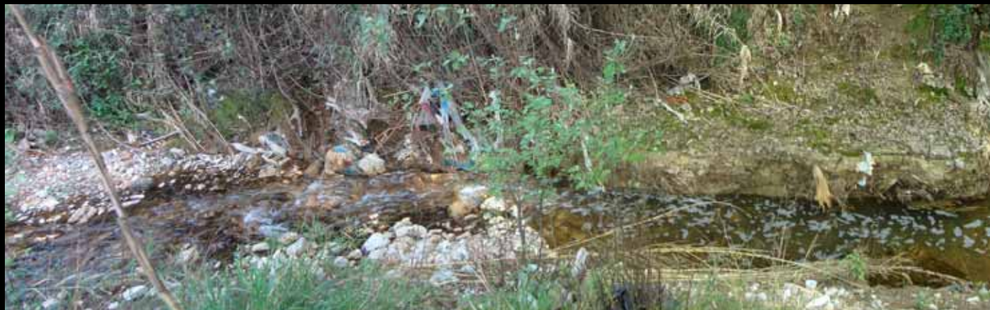
Προσεγγίσεις του Εφαρμοσμένου Αστικού Σχεδιασμού στην Ελλάδα - Δήμος Αχαρνών

Εθνικό Μετσόβιο Πολυτεχνείο // Σχολή Αρχιτεκτόνων Μηχανικών // ΔΠΜΣ: Αρχιτεκτονική - Σχεδιασμός του Χώρου // Κατεύθυνση Β': Πολεοδομία - Χωροταξία