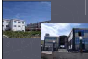
Εικόνες: Δραστηριοποιούμενες επιχειρήσεις στην περιοχή, Βόρεια της Α. Κορυμνιάς.

*ΕΓΚΑΤΑΣΤΑΣΕΙΣ ΕΜΠΟΡΙΚΩΝ ΕΚΘΕΣΕΩΝ *ΕΠΑΓΓΕΛΜΑΤΙΚΑ ΕΡΓΑΣΤΗΡΙΑ - ΒΙΟΤΕΧΝΙΕΣ - ΧΑΜΗΛΗΣ ΟΧΛΙΝΗΣ *ΕΜΠΟΡΙΚΑ ΚΑΤΑΣΤΗΜΑΤΑ *ΤΡΑΠΕΖΕΣ, ΑΣΦΑΛΕΙΕΣ, ΟΡΓΑΝΙΣΜΟΙ *ΧΩΡΟΙ ΣΥΝΑΘΡΟΙΣΗΣ ΚΟΙΝΟΥ *ΚΤΗΡΙΑ ΚΟΙΝΩΝΙΚΗΣ ΠΡΟΝΟΙΑΣ *ΓΗΠΕΔΑ ΣΤΑΘΜΕΥΣΗΣ *ΠΡΑΤΗΡΙΑ ΒΕΝΖΙΝΗΣ