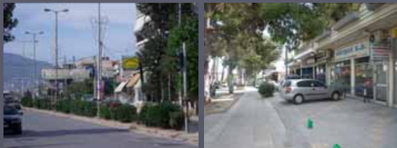
Παρόδιες κεντρικές (εμπορικές) λειτουργίες επί των οδών Δημοκρατίας και Φιλαδέφειας αντίστοιχα.