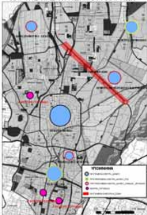
ΧΑΡΤΗΣ 1-ΚΕΝΤΡΑ ΔΗΜΟΥ ΑΧΑΡΝΩΝ

ΕΓΚΑΤΑΣΤΑΣΕΙΣ ΜΜΜ ΕΜΠΟΡΙΚΑ ΚΑΤΑΣΤΗΜΑΤΑ ΓΡΑΦΕΙΑ ΤΡΑΠΕΖΕΣ, ΑΣΦΑΛΕΙΕΣ, ΟΡΓΑΝΙΣΜΟΙ ΔΙΟΙΚΗΣΗ ΕΓΚΑΤΑΣΤΑΣΕΙΣ ΕΜΠΟΡΙΚΩΝ ΕΚΘΕΣΕΩΝ ΕΣΤΙΑΤΟΡΙΑ, ΚΕΝΤΡΑ ΔΙΑΣΚΕΔΑΣΗΣ, ΑΝΑΨΥΧΗΣ ΓΗΠΕΔΑ ΣΤΑΘΜΕΥΣΗΣ