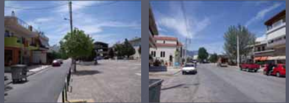
Ήπια οικιστική ανάπτυξη στην περιοχή της Νεάπολης.

Επί της Οδού Αγ. Διονυσίου όπου χωροθετείται η εκκλησία μαζί με την πλατεία, έχουν αρχίσει να εγκαθίστανται διάφορες κεντρικές λειτουργίες όπως super markets, εστιατόρια, πρατήρια βενζίνης.