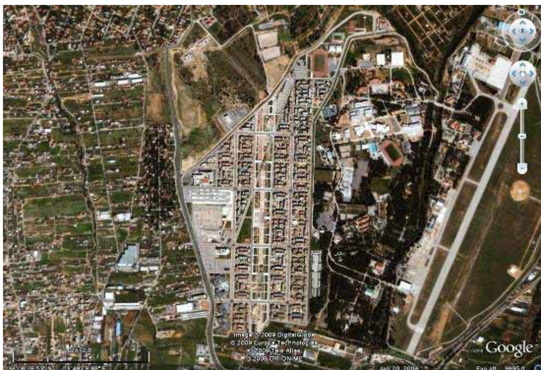
Εικόνα 1 Το Ολυμπιακό χωριό από «ψηλά»

εγκαταστάσεις, ανεξέλεγκτη απόρριψη απορριμμάτων. Αρκετά τμήματα της έκτασης είναι σήμερα χέρσα, λόγω της υποχώρησης της προγενέστερης γεωργικής χρήσης, από την διάχυτη αστικοποίηση και οικοπεδοποίηση που βρίσκεται σε εξέλιξη. Στην χαρακτηρισμένη ως γεωργική γη υψηλής παραγωγικότητας περιοχή Πάτημα Δημόγλη οι εναπομείνασες γεωργικές εκμεταλλεύσεις εντατικού χαρακτήρα, καλύπτουν μικρά ποσοστά της συνολικής έκτασης της περιοχής, κυρίως στο νότιο άκρο της.