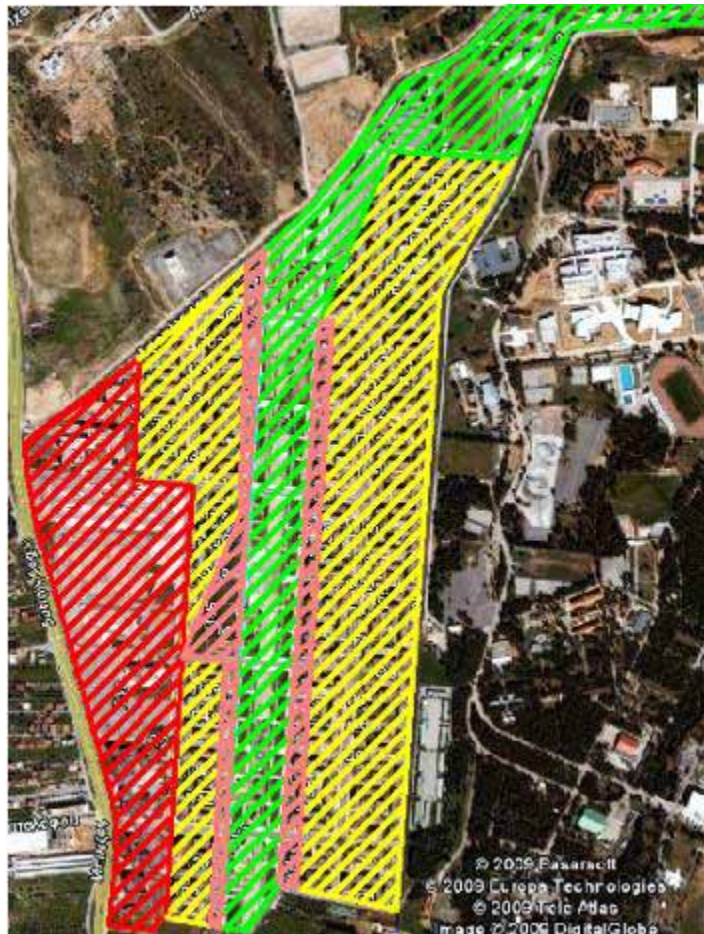
Εικόνα 6 Εναλλακτικό σενάριο θεσμοθέτησης ζώνης γενικής κατοικίας (πορτοκαλί χρώμα) εντός της περιοχής μελέτης

Η μίξη αυτή θα μπορούσε να επιτευχθεί λοιπόν με τη δημιουργία μιας μικρής ζώνης γενικής κατοικίας εκατέρωθεν της θεσμοθετημένης ζώνης πρασίνου (βλ. εικόνα 6), αντί της αμιγούς κατοικίας που ισχύει σήμερα, και την εγκατάσταση εκεί, μαζί με την κατοικία, καταστημάτων ή γραφείων. Μία τέτοια κίνηση οπωσδήποτε θα ενέτεινε τις δραστηριότητες και στο εσωτερικό του Ολυμπιακού Χωριού, αίροντας έτσι πιθανές συνθήκες κοινωνικού αποκλεισμού της περιοχής. Με αυτόν τον τρόπο, όμως, η περιοχή θα φορτιστεί με επιπλέον επισκέπτες, με αποτέλεσμα η ζώνη κατοικίας να χάσει ως ένα βαθμό το χαρακτήρα της ως περιοχής αμιγούς κατοικίας και ως «προτύπου πολιτείας». Βέβαια, το τελευταίο αυτό στοιχείο είναι μάλλον σχετικά, καθώς έχει να κάνει περισσότερο με το τι ακριβώς θέλουμε για την περιοχή μας.