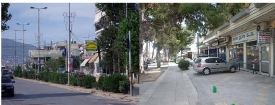
Εικόνες 7- 8 : Παρόδιες κεντρικές (εμπορικές) λειτουργίες επί των οδών Δημοκρατίας και Φιλαδέλφειας αντίστοιχα.

Επίσης, ένα άλλο στοιχείο που χαρακτηρίζει την περιοχή είναι η γραμμική ανάπτυξη παρόδιων κεντρικών λειτουργιών κατά μήκος πρωτεύοντων οδικών αξόνων. Έτσι, τάσεις ανάπτυξης κεντρικών λειτουργιών, κυρίως εμπορίου και λιγότερο γραφείων και υπηρεσιών, παρατηρείται κατά μήκος των οδών Δημοκρατίας, Φιλαδέλφειας, Λιοσίων και Δεκελείας.