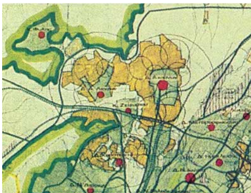
Εικόνα 4: Απόσπασμα Ρυθμιστικού Σχεδίου Αθήνας 1985. Χάρτης οικιστικής οργάνωσης.

οικιστική ενότητα του Λεκανοπεδίου, περιοριζόμενη προς βορά από την Πάρνηθα, ενώ προς τις τρεις άλλες κατευθύνσεις από σημαντικούς οδικούς άξονες (Αττική Οδός, περιφερειακή Αιγάλεω, Εθνική Οδός Αθηνών - Λαμίας). Η σύγκρισή τέλος των προβλεπόμενων «νέων οικιστικών ενοτήτων» με την έκταση των περιοχών του ισχύοντος Σχεδίου Πόλης, οι οποίες επίσης σημειώνονται στο χάρτη του ΡΣΑ (με ανοικτό πράσινο χρώμα), κάνει κατανοητό ότι η υλοποίησή τους προϋποθέτει ιδιαίτερα εκτεταμένες νέες εντάξεις περιοχών στο Σχέδιο Πόλης (οι οποίες εν τω μεταξύ έχουν ήδη ολοκληρωθεί με ακόμη μεγαλύτερη ένταση, από τον Γενικό Πολεοδομικό Σχεδιασμό της περιοχής).