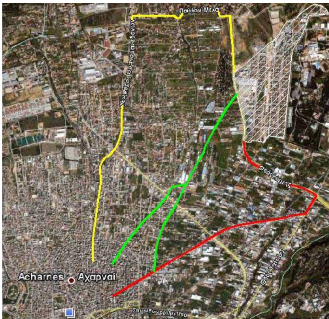
Εικόνα 5 Υφιστάμενες (κόκκινο & κίτρινο χρώμα) και προτεινόμενες (πράσινο χρώμα) διαδρομές σύνδεσης Μενιδίου - Ολυμπιακού Χωριού

Είναι προφανές από το χάρτη ότι και οι δύο τρόποι απέχουν πολύ από το να χαρακτηριστούν ιδανικοί. Έτσι, γίνεται κατανοητό ότι εξίσου σημαντικό με την πολεοδομική οργάνωση της περιοχής, είναι και η οργάνωση βασικών αξόνων πρόσβασης προς αυτή, πάνω στους οποίους θα αναπτυχθούν οι κοινωνικές εξυπηρετήσεις και οι εμπορικές δραστηριότητες των πολεοδομικών και θα εξασφαλιστεί η απρόσκοπτη συνδεσιμότητα μεταξύ των επιμέρους πολεοδομικών ενότητων του Δήμου, με σκοπό την ομαλή μετάβαση από τη μία πολεοδομική ενότητα στην άλλη και τη δημιουργία ζωντανών περιοχών στον αστικό ιστό.