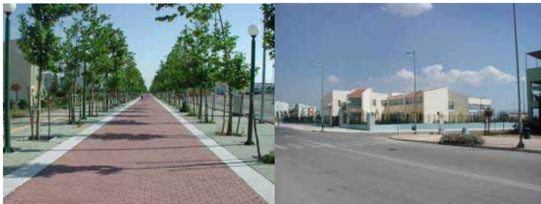
Εικόνες 2-3 Χαρακτηριστική εικόνα «ερήμωσης» του Ολυμπιακού χωριού

Πιο συγκεκριμένα, δε θα ήταν υπερβολή να πούμε ότι το Ολυμπιακό χωριό παρουσιάζει σήμερα την εικόνα μιας «έρημης πόλης»! Η κίνηση αυτοκινήτων και πεζών στους εξαιρετικής ρυμοτομίας δρόμους του οικιστικού συγκροτήματος είναι εξαιρετικά περιορισμένη, ενώ σχεδόν ανύπαρκτη είναι και η καθημερινή κοινωνική ζωή των κατοίκων του, καθώς λείπουν τα απαραίτητα σημεία συγκέντρωσης του πληθυσμού (καταστήματα, χώροι πολιτισμού - αναψυχής, δημόσιες υπηρεσίες κτλ.). Έτσι, οι κάτοικοι του Ολυμπιακού χωριού είναι υποχρεωμένοι να πάρουν το αυτοκίνητό τους (η συγκοινωνία που εξυπηρετεί την περιοχή χαρακτηρίζεται τουλάχιστον ελλιπής) και να αναζητήσουν χώρους εκτός της περιοχής ώστε να ικανοποιήσουν καθημερινές τους ανάγκες. Αποτέλεσμα αυτού, η αίσθηση απομόνωσης την οποία αισθάνονται οι κάτοικοί του, και η αίσθηση «γκετοποίησης» την οποία εισπράττουν οι επισκέπτες της περιοχής, την οποία ευνοούν και τα 7 χιλιόμετρα συρματοπλέγματος γύρω από την περιοχή κατοικίας. Επίσης, στους κοινόχρηστους χώρους του (πλατείες, πεζοδρόμια κλπ) έκδηλη είναι η εικόνα εγκατάλειψής τους και η αίσθηση σταδιακής υποβάθμισης του δημόσιου χώρου.