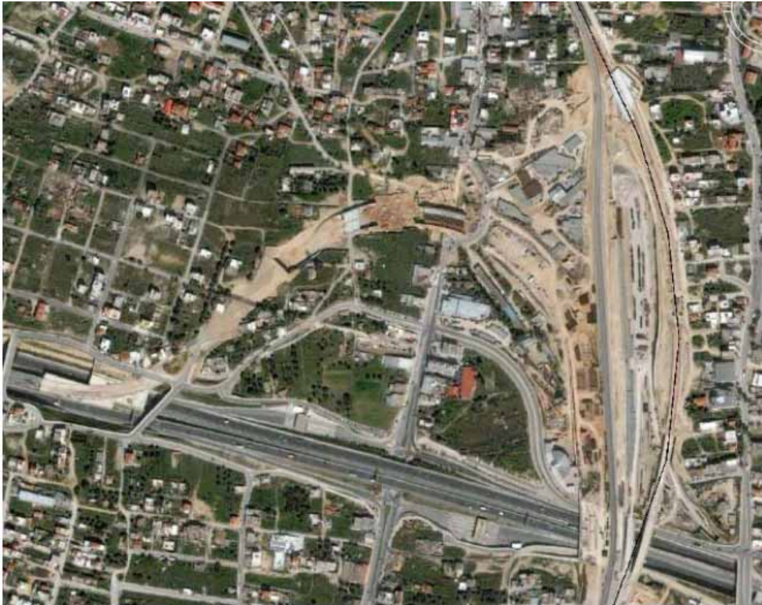
Εικόνα 9: Το Σ.Κ.Α. του δήμου Αχαρνών από ψηλά

Η περιοχή όπου τοποθετείται το ΣΚΑ επιλέχθηκε γιατί αποτελεί κόμβο ως προς τη δεδομένη υποδομή του σιδηροδρομικού και οδικού δικτύου. Αναλύοντας την περιοχή αυτή, μπορεί να χαρακτηριστεί ως μια περιοχή γενικής κατοικίας, με κάποιες χρήσεις βιοτεχνίας και συνεργείων στο μέτωπο της λεωφόρου Δημοκρατίας. Είναι αρκετά αραιοκατοικημένη και ένα μεγάλο τμήμα της είναι εκτός σχεδίου. Μοιάζει, λοιπόν, να είναι μια περιοχή που βρίσκεται σε αναμονή για να παραλάβει νέες χρήσεις.