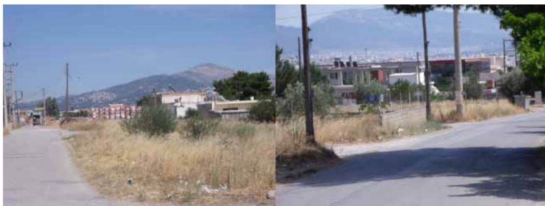
Εικόνες 12 – 13 : Άναρχη και αραιή οικιστική ανάπτυξη στην περιοχή Αγριλέζα και Μεγάλα Σχοίνα.

Στο ΓΠΣ του Δήμου Αχαρνών έχουν προταθεί στην περιοχή Αγριλέζας και Μεγάλα Σχοίνα κάποια κέντρα γειτονιάς. Έπειτα από επιτόπια επίσκεψη διαπιστώθηκε ότι στην περιοχή δεν υπάρχουν καθόλου κεντρικές λειτουργίες, ενώ κυρίαρχη είναι η αραιοδομημένη και άναρχη οικιστική ανάπτυξη. Έτσι, εκτός από κατοικία και αγροτική γη, χωροθετούνται και κάποιες διασκορπισμένες και μικρές λειτουργίες, όπως αποθήκες και mini markets. Κατά συνέπεια, δεν είναι δυνατόν με τις παρούσες συνθήκες να δημιουργηθεί κάποιο κέντρο γειτονιάς στην περιοχή, τουλάχιστον υπό τις παρούσες συνθήκες.