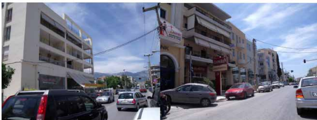
Εικόνες 5-6: Ανάπτυξη κεντρικών λειτουργιών στη διασταύρωση Αριστοτέλους – Θρακομακεδόνων.

Επίσης, ένα άλλο στοιχείο που χαρακτηρίζει την περιοχή είναι η γραμμική ανάπτυξη παρόδιων κεντρικών λειτουργιών κατά μήκος πρωτεύοντων οδικών αξόνων. Έτσι, τάσεις ανάπτυξης κεντρικών λειτουργιών, κυρίως εμπορίου και λιγότερο γραφείων και υπηρεσιών, παρατηρείται κατά μήκος των οδών Δημοκρατίας, Φιλαδέλφειας, Λιοσίων και Δεκελείας.