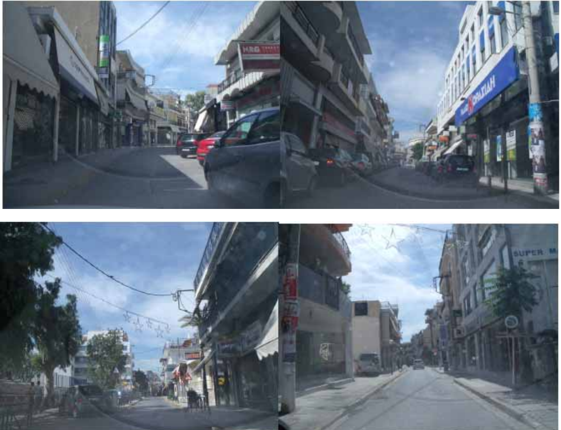
Εικόνες 1-4 : Εικόνες από το κέντρο του Μενιδίου

Σε ότι αφορά τον Δήμο Αχαρνών, με εξαίρεση το παλαιό κέντρο της πόλης (Μενίδι), κυρίαρχο χαρακτηριστικό είναι η μεγάλη διάχυση - διασπορά κεντρικών λειτουργιών. Πιο συγκεκριμένα, το Μενίδι αποτελεί αυτή τη στιγμή το μοναδικό σημειακό κέντρο του Δήμου, στο οποίο συγκεντρώνεται ένας μεγάλος αριθμός κεντρικών λειτουργιών της περιοχής, που έχουν να κάνουν με διοίκηση, υπηρεσίες, πολιτισμό, εμπόριο, γραφεία και ψυχαγωγία αναψυχή.