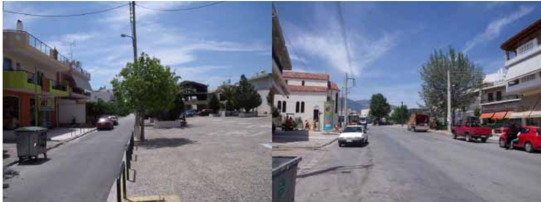
Εικόνες 14 – 15 : Ήπια οικιστική ανάπτυξη στην περιοχή της Νεάπολης.

Τα κέντρα γειτονιάς, επίσης, μπορούν να λάβουν ένα χαρακτήρα αποσυμφόρησης της γραμμικής - παρόδιας ανάπτυξης κεντρικών λειτουργιών επί μεγάλων οδικών αξόνων. Για το λόγο αυτό, απαραίτητη κρίνεται η δημιουργία δύο ακόμη κέντρων γειτονιάς, ένα το οποίο θα συνορεύει με την Οδό Δημοκρατίας, κάτω από το κέντρο ΣΚΑ, και ένα λίγο πιο ανατολικά που θα συνορεύει με την Οδό Φιλαδελφείας. Στους δύο δρόμους, όπως ήδη έχει αναφερθεί, παρατηρείται οικιστική ανάπτυξη, ενώ υπάρχουν και αρκετές εμπορικές λειτουργίες.