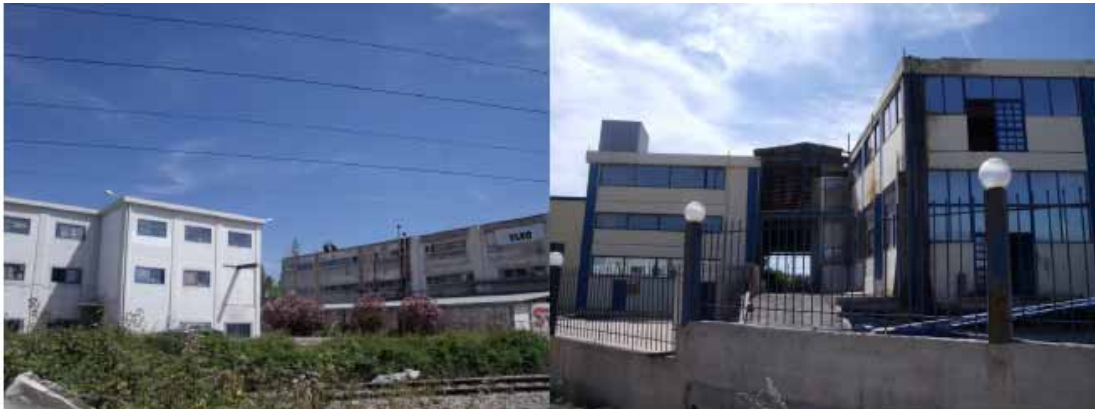
Εικόνες 10- 11: Δραστηριοποιούμενες επιχειρήσεις στην περιοχή, βόρεια της Λ. Καραμανλή.

6) Το τελευταίο, αλλά ίσως πιο σημαντικό, κέντρο το οποίο προτείνεται στην περιοχή μελέτης είναι το Ολυμπιακό Χωριό . Η πρόταση για το Ολυμπιακό Χωριό, το οποίο αποτελεί και τη χωρική εξειδίκευση της παρούσας εργασίας, παρουσιάζεται αναλυτικά σε επόμενο κεφάλαιο.