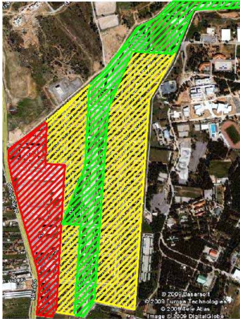
Εικόνα 4 Θεσμοθετημένες ζώνες Ολυμπιακού χωριού

Σύμφωνα με τον αρχικό προγραμματισμό, μετά τους Ολυμπιακούς Αγώνες, η ζώνη κατοικίας της Ολυμπιακής χρήσης θα μετατρέποταν σε περιοχή κατοικίας που θα περιλάμβανε και εξυπηρετήσεις όπως καταστήματα επιπέδου γειτονιάς, ελεύθερους χώρους, πράσινο και αθλητικές εγκαταστάσεις. Στην πράξη, δεν υπήρξε ενδιαφέρον για τη δημιουργία καταστημάτων επιπέδου γειτονιάς, λόγω των πολύ υψηλών ενοικίων και του περιορισμένου αγοραστικού κοινού που κινείται στην περιοχή.