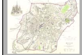
Map of Moscow 1836

Η Μόσχα κατοικήθηκε στα τέλη της 1 ης χιλιετίας μ.Χ. από τους Σλάβους Βιστίπτι και ΒΔ από το σημερινό της κέντρο από τους Κριβίτι. Στα τέλη του 11 ου αιώνα ήταν μια μικρή πόλη στις εκβολές του ποταμού Νεγκλίγια με φεουδαλικό κέντρο και μικρο εμποροβιοτεχνικό περίγυρο. Κατά το τελευταίο τέταρτο του 15 ου αιώνα επι μεγάλου πρίγκηπα Ιβάν Γ' Βασιλέβιτς, η Μόσχα γίνεται πρωτεύουσα του συγκεντρωμένου κράτους που αποπνίγει τον μογγολοταταρικό ύγχο. Το 16 ο αιώνα η Μόσχα ξεπερνάει σε μέγεθος το Λονδίνο, την Πράγα και άλλες Δυτικοευρωπαϊκές πόλεις. Ύστερα πρωτεύουσα της Ρωσικής Αυτοκρατορίας γίνεται η Αγία Πετρούπολη και μετά την Οκτωβριανή Επανάσταση το 1917 η Μόσχα γίνεται πρωτεύουσα της Ε.Σ.Σ.Δ. και από το 1991 και μετά της Ρωσικής Ομοσπονδίας. Μετά το 1917 άρχισε η ριζική ανασυγκρότηση της Μόσχας με βάση τις νέες αρχές της πολεοδομίας. Μεταξύ 1918 και 1925 εκπονήθηκε σχέδιο για τη "νέα" Μόσχα (όμιλος αρχιτεκτόνων υπό τον Α.Β. Σούσεφ) το οποίο ήταν κυρίως αρχιτεκτονικό και λιγότερο πολεοδομικό ενδιαφέροντος. Το γενικό σχέδιο όμως του 1935 ήταν αυτό που δημιούργησε την εικόνα της Μόσχας που διατηρείται μέχρι και σήμερα, εικόνας πολύ αξιοληυτικής μιάς και κατέχει μια από τις υψηλότερες θέσεις στις πόλεις με μεγαλύτερο ποσοστό πρασίνου ανα κάτοικο.