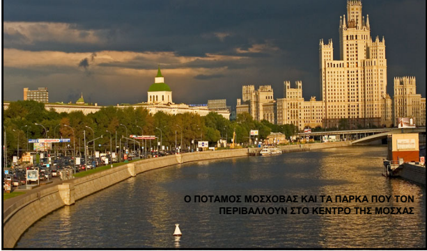
Ο ΠΟΤΑΜΟΣ ΜΟΣΧΩΒΑΣ ΚΑΙ ΤΑ ΠΑΡΚΑ ΠΟΥ ΤΟΝ ΠΕΡΙΒΑΛΛΟΥΝ ΣΤΟ ΚΕΝΤΡΟ ΤΗΣ ΜΟΣΧΑΣ