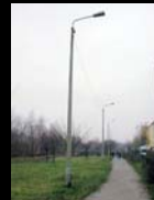
Φωτισμός και Δρόμος Περιτολίας