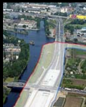
Λιμάνι Britz - Ost