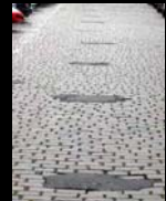
Πρώην Θεμελίωση του Τείχους