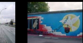
East Side Gallery