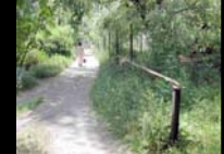
Δρόμος Περιτολίας -