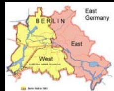
Χάρτης Διχοτόμησης Βερολίνου