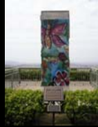
Κομμάτι του Τείχους στην προσωρινή βιβλιοθήκη Ronald Reagan, Καλιφόρνια