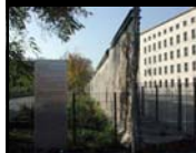
Κομμάτι του Τείχους στη Niederkirchner Strasse