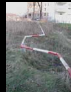
Μπάρα - Οριογραμμή