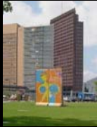
Κομμάτι του Τείχους στην Potsdamer Platz