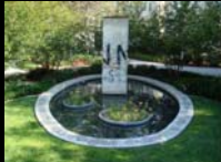
Κομμάτι του Τείχους στη Liberty Plaza στο campus του Chapman University, Καλιφόρνια