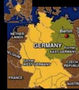
Χάρτης Διχοτόμησης Γερμανίας