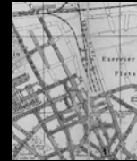
Πρώην Χρήση Σιδηροδρομικού Σταθμού