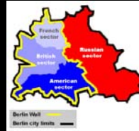
Διχοτομισμός σε Τομείς