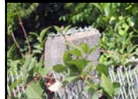
Φράχτης με καρφιά