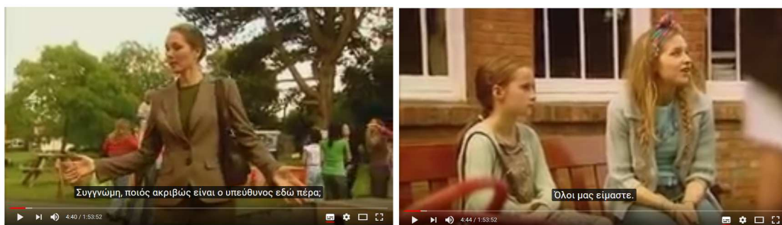
Εικόνες 8.,9. Στιγμιότυπα από την ταινία Jon East με θέμα το αντιαυταρχικό σχολείο Summerhill 17

Στο αντιαυταρχικό σχολείο, οι μαθητές δεν απολαμβάνουν μία ασύδοτη ελευθερία κάνοντας κατάχρηση της παιδικής τους ηλικίας και ελευθερίας, αλλά μία συνειδητοποιημένη σχέση ισοτιμίας στον σχολικό χώρο με παράλληλο σεβασμό στην προσωπικότητα και τα θέλω τόσο των συνομηλίκων τους, όσο και των ενηλίκων που εργάζονται σε αυτή 16 . (Εικόνα 8., 9.)