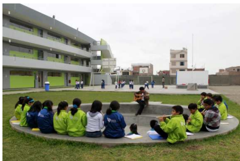
Εικόνα 6. Innova Schools, Λίμα, Περού

Εικόνες 2., 3., 4., 5., 6., 7. Εικόνες από σχολεία με δημιουργικό και πρωτοποριακό τρόπο εκπαίδευσης από όλο τον κόσμο 14