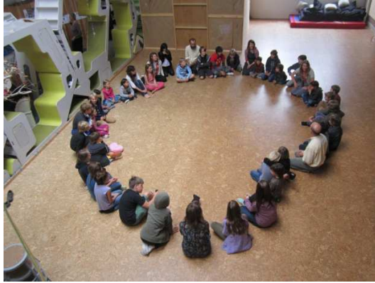
Εικόνα 2. Brightworks School, Σαν Φρανσίσκο, ΗΠΑ

προσέγγιση στην μάθηση, η οποία εξετάζεται και αναπροσαρμόζεται σε συνεργασία μεταξύ δασκάλων, παιδιών και των γονιών τους, κάθε 6 εβδομάδες. (Εικόνα 7.)