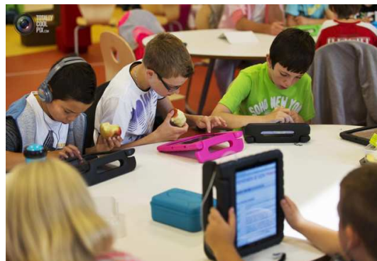
Εικόνα 7. Steve Jobs School, Άμστερνταμ, Ολλανδία

Εικόνες 2., 3., 4., 5., 6., 7. Εικόνες από σχολεία με δημιουργικό και πρωτοποριακό τρόπο εκπαίδευσης από όλο τον κόσμο 14