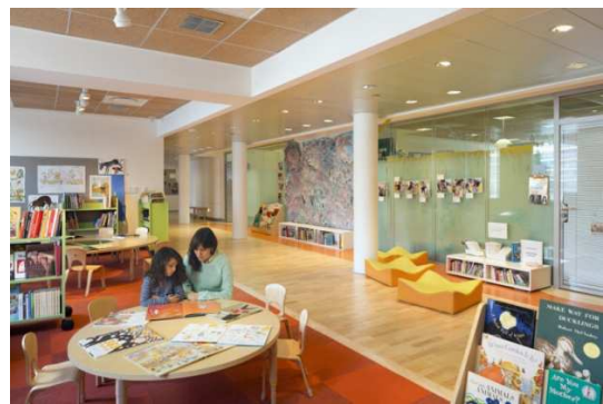
Εικόνα 5. Blue School, Νέα Υόρκη, ΗΠΑ