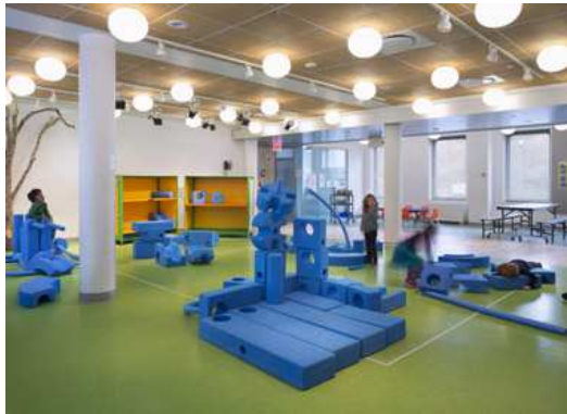
Εικόνα 4. Blue School, Νέα Υόρκη, ΗΠΑ