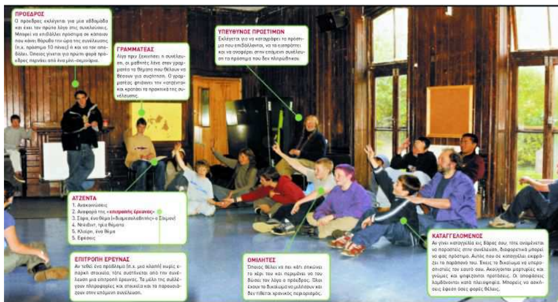
Εικόνα 1. Η δομή ενός συμβουλίου στο Summerhill 12

14. “Να μπορούν τα παιδιά να ζουν σε μια κοινότητα που τα υποστηρίζει και που κι εκείνα είναι υπεύθυνα γι’ αυτήν, έχοντας την ελευθερία να είναι οι εαυτοί τους και τη δύναμη να αλλάζουν τη ζωή τους, μέσα από δημοκρατικές διαδικασίες και λειτουργίες”.