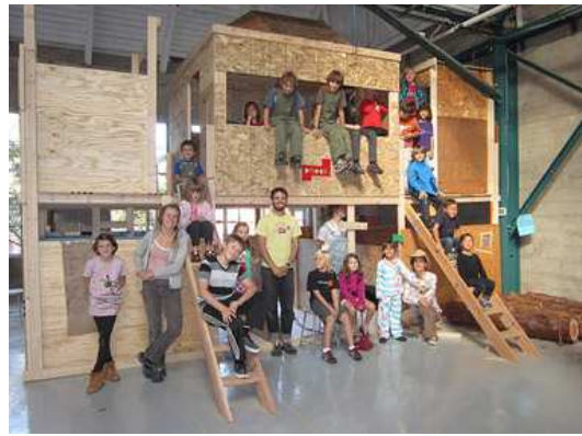
Εικόνα 3. Brightworks School, Σαν Φρανσίσκο, ΗΠΑ