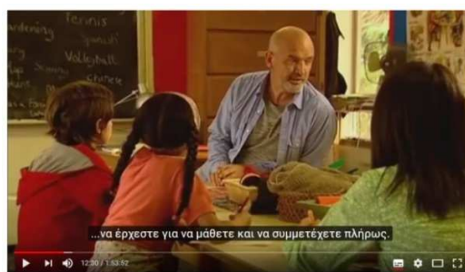
Εικόνες 11.,12. Στιγμιότυπα από την ταινία Jon East με θέμα το αντιαυταρχικό σχολείο Summerhill 18