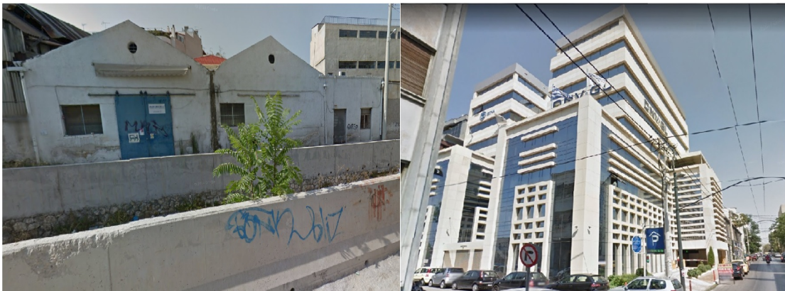
Εικόνα 1: Η παρουσία Υποβαθμισμένων θυλάκων με γειτνιάζοντες Αναβαθμισμένους Θύλακες Τριτογενοποίησης

Η συνοικία του Αγίου Διονυσίου αποτελούσε και αποτελεί και σήμερα, περιοχή με μεγάλη συγκέντρωση βιομηχανικών μονάδων και βιοτεχνιών και ελάχιστη παρουσία, κατά αναλογία, κατοικίας. Η φάση της αποβιομηχανικής δεν θα μπορούσε να αφήσει ανεπηρέαστη την εν λόγω περιοχή, καθώς οι μετασχηματισμοί και οι επιπτώσεις της είναι εμφανείς σε όλη την έκτασή της, με διαφορετικές εντάσεις. Η συρρίκνωση των βιοτεχνιών με παράλληλη μεγέθυνση και εντατικοποίηση των δραστηριοτήτων εμπορίου και υπηρεσιών, οι οποίες σχετίζονται με την γενικότερη τριτογενοποίηση της παραγωγής, προκαλούν άμεσα και ποικίλα χωρικά αποτελέσματα που αφορούν, πέρα των άλλων, (Α) στην ύπαρξη κενών κτιρίων και εγκαταλελειμμένων βιομηχανικών και βιοτεχνικών χώρων, σε συνθήκες πλήρους απαξίωσης και υποβάθμισης και (Β) στην δημιουργία νέων "πιάσεων" συγκέντρωσης δραστηριοτήτων τριτογενούς τομέα, ως αναβαθμισμένοι θύλακες.