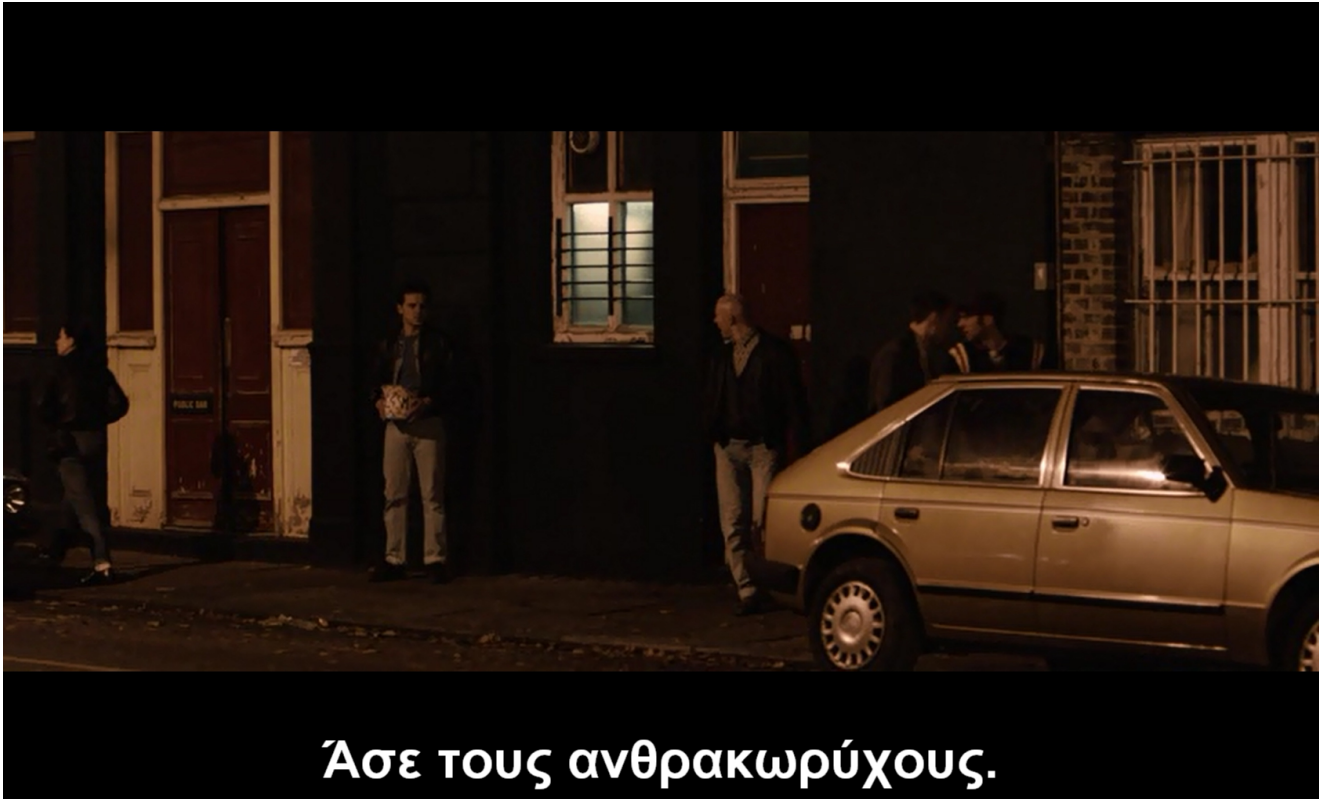
εικ. 4: λεκτική αντιπαράθεση ομοφυλόφιλων για τους ανθρακωρύχους