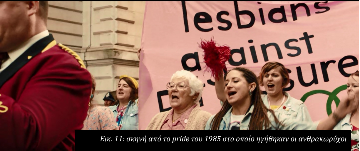
Εικ. 11: σκηνή από το pride του 1985 στο οποίο ηγήθηκαν οι ανθρακωρύχοι