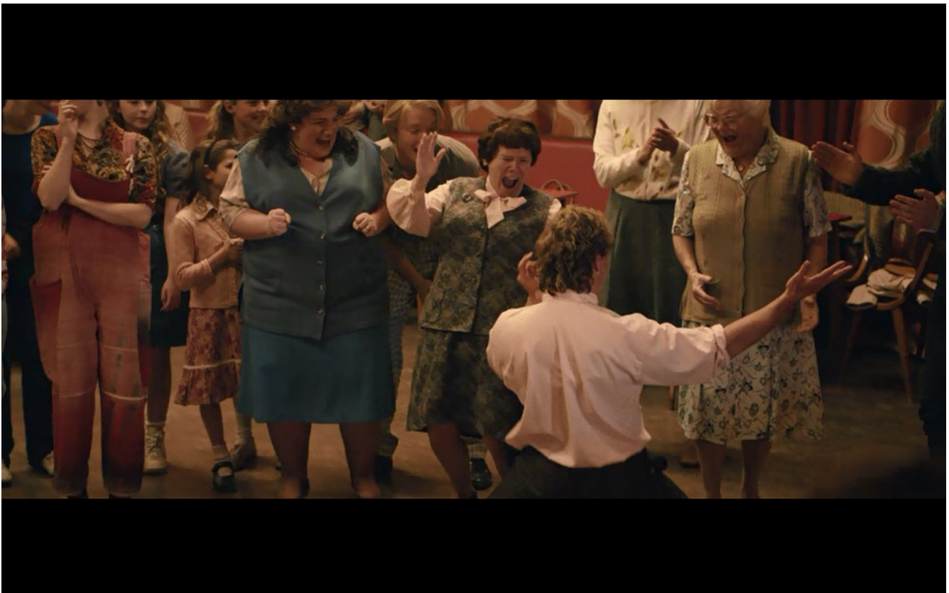
εικ. 8: χορός στη λέσχη

μικρή σημασία άρχισε να υπονομεύει τα προϋπάρχοντα σκληρά όρια. Τέτοιες πρακτικές ήταν για παράδειγμα ο ξέφρενος χορός των γυναικών μαζί με έναν gay από τους LGSM (εικ. 8), «πειθόντας» ένα νεαρό εργάτη να μάθει να χορεύει ή οι νομικές συμβουλές για την αποφυλάκιση δύο νεαρών εργατών. Στο τέλος αυτής της διαδικασίας ο ηγέτης των LGSM ανεβασμένος πάνω σε ένα τραπέζι, βγάζει ένα συγκινητικό και ενθαρρυντικό λόγο στη λέσχη των ανθρακωρύχων με αποτέλεσμα όλοι και όλες να τον χειροκροτούν στο τέλος. Πλέον ο χώρος της λέσχης δεν έχει καμία σχέση με το χώρο εκείνο που μας παρουσιάστηκε αρχικά, τα συμβολικά όρια του έχουν μετασχηματισθεί και έχει εξαλειφθεί η κοινωνική περιθωριοποίηση των ΛΟΑΤΚΙ στο συγκεκριμένο χώρο. Οι διάφορες πρακτικές οικειοποίησης των LGSM, είτε ατομικές και καθημερινές είτε στοχευμένες και συλλογικές κατάφεραν να διευρύνουν τα όρια αυτού του χώρου, ίσως σε μία μικρογραφία της προσπάθειας τους να οικειοποιηθούν το δημόσιο χώρο.