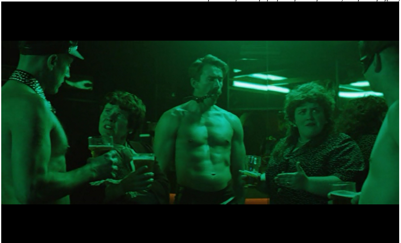
εικ. 5: έξοδος σε gay club