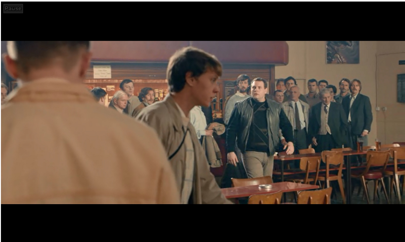
εικ. 7: ο διχοτομημένος χώρος

Ο χώρος στην αρχή εμφανίζεται διχοτομημένος, με μία κενή από σώματα ζώνη ως όριο, ανάμεσα στους «περίεργους» και «ανεπιθύμητους» από τη μία και τους «κανονικούς» από την άλλη (εικ. 7). Στη συνέχεια η μεγαλύτερη ανοχή των γυναικών, που έστω και υποσεινήδητα έβλεπαν στην περιθωριοποίηση των LGSM τη δικιά τους έμφυλη καταπίεση, άρχισε να τους δίνει περισσότερο «χώρο» στους LGSM και η ανάπτυξη μιας σειράς καθημερινών πρακτικών, με φαινομενικά πολύ