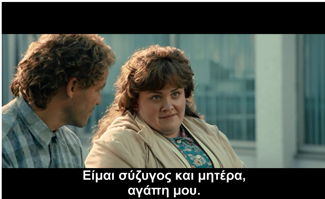
εικ. 9: επιστροφή στην «κανονικότητα»

Στην ταινία έχουμε δύο πολύ χαρακτηριστικά παραδείγματα και τα δύο προς το τέλος της ταινίας. Η μία σκηνή αφορά μία ηγετική γυναικεία μορφή από την εργατούπολη της Νότιας Ουαλίας (που σε όλη την ταινία παρακολουθούμε πώς από σύζυγος και νοικοκυρά αναλαμβάνει καίριες ευθύνες στην οργάνωση της αλληλεγγύης στην απεργία) η οποία στην ερώτηση του τι σκέφτεται να κάνει με τη ζωή της (αφού η απεργία έχει λήξει και ηττηθεί) η απάντησή της είναι ότι θα γυρίσει στους κανονικούς ρυθμούς ζωής, αφού είναι σύζυγος και μητέρα (εικ. 9). Η δεύτερη σκηνή μας δείχνει δύο μέλη των LGSM (έναν γκέι και μία λεσβία) που έχουν αναπτύξει ισχυρούς φιλικούς δεσμούς μεταξύ τους να είναι ξαπλωμένοι στο κρεβάτι και να μας λένε πως αν ήταν κανο-