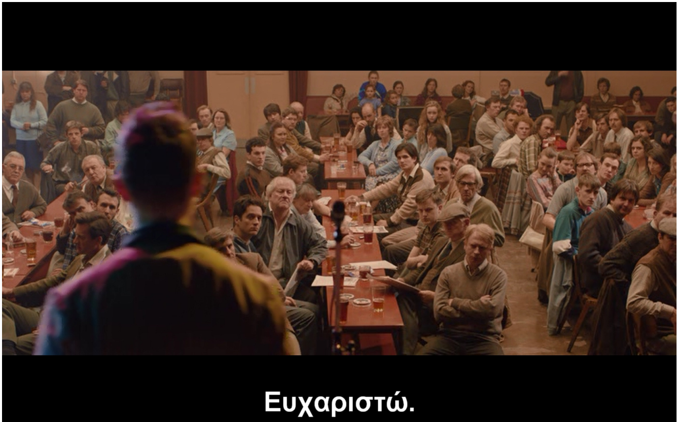
εικ. 6: η λέσχη των ανθρακωρύχων

Το επόμενο χαρακτηριστικό παράδειγμα ενδιάμεσου χώρου στην ταινία είναι η λέσχη των ανθρακωρύχων στη Νότια Ουαλία, ο οποίος υποπτευόμαστε ότι πιθανότατα ανήκει ιδιοκτησιακά στο συνδικάτο των εργαζομένων. Δεδομένης της μεγάλης και μακρόσυρτης απεργίας των ανθρακωρύχων, το κέντρο της καθημερινής ζωής στη μικρή εργατούπολη έχει ουσιαστικά μεταφερθεί στη λέσχη, διαρρηγνύοντας το διπολισμό μεταξύ ιδιωτικού και δημόσιου. Σε αυτόν το χώρο και κατά τη διάρκεια της απεργίας οι εργάτες αποκτούν συλλογική υπόσταση και ταυτότητα, δεν είναι πλέον το μεμονωμένο αρσενικό που θα πάει στο χώρο εργασίας, ενδεχομένως θα κοινωνικοποιηθεί ή θα πολιτικοποιηθεί, εξασκώντας το «φυσικό» του δικαίωμα στο δημόσιο χώρο ενώ η γυναίκα σύζυγος και νοικοκυρά θα παραμείνει στην ιδιωτική σφαίρα της κατοικίας φροντίζοντας για την κοινωνική αναπαραγωγή, σε ένα σκιώδη χώρο ανισότητας. 5 Κατά τη διάρκεια της απεργίας οι γυναίκες έχουν αναλάβει σχεδόν εξολοκλήρου τη διαχείριση των οικονομικών και οργανωτικών ζητημάτων της λέσχης αλλά και της ίδιας της απεργίας, ενάντια στον κυρίαρχο έμφυλο ρόλο που επιτελούσαν προηγουμένως. Βέβαια, την ίδια στιγμή όταν βλέπουμε την προετοιμασία του φαγητού για παράδειγμα, θα δούμε μόνο τις γυναίκες να καταπιάνονται με αυτή τη διαδικασία, μεταφέροντας τους ίδιους έμφυλους ρόλους που είχαν μάθει και «εκπαι-