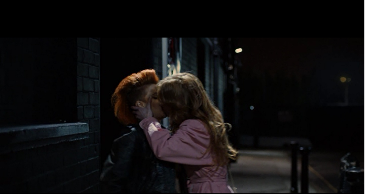
Εικ. 10: δύο γυναίκες φιλιούνται στο δημόσιο χώρο