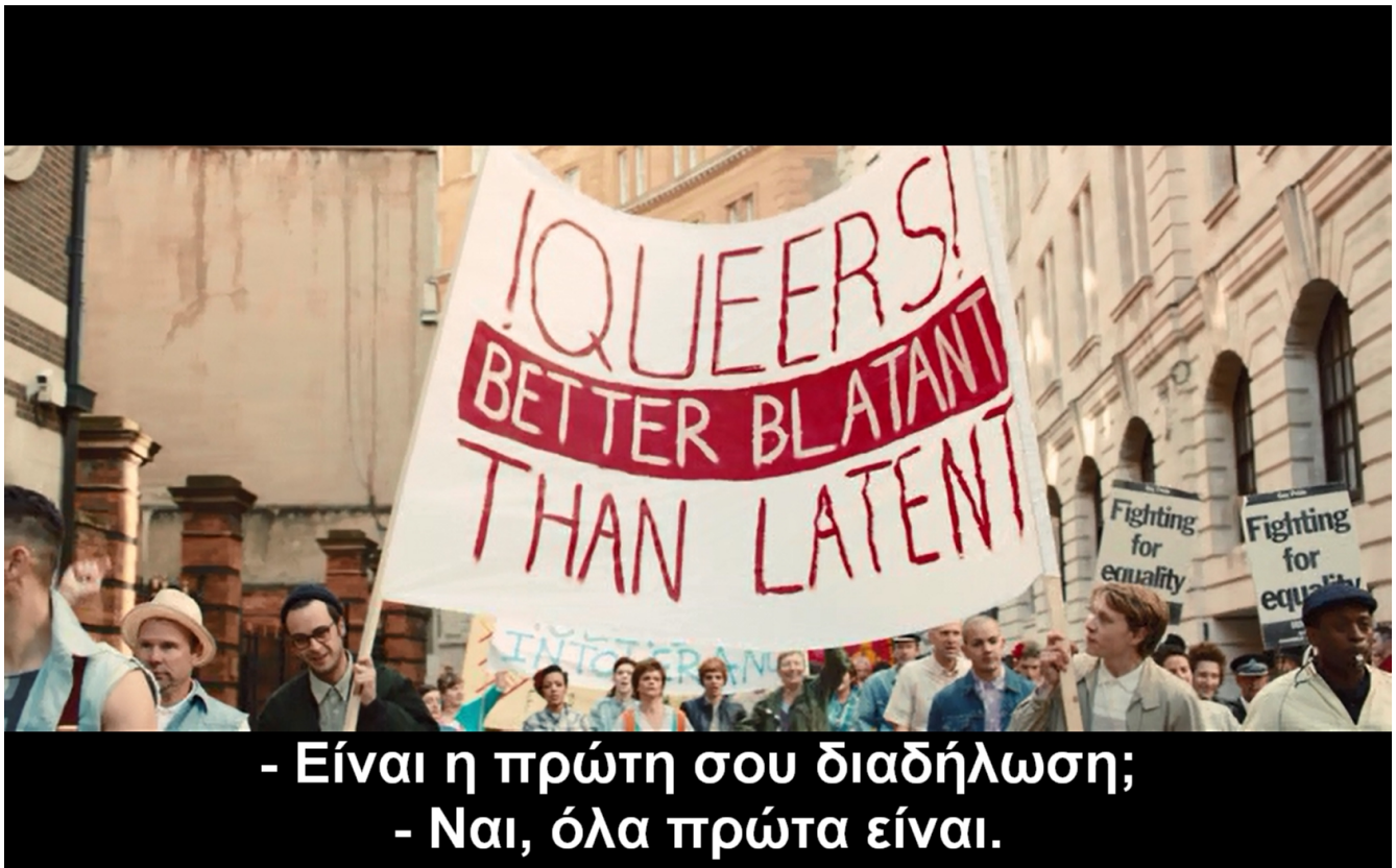
εικ. 1: στιγμιότυπο από την εναρκτήρια σκηνή στη διαδήλωση του pride

Η ταινία «Pride» είναι βασισμένη στην αληθινή ιστορία μιας ομάδας ακτιβιστών/ριών της ΛΟΑΤ-ΚΙ κοινότητας του Λονδίνου (LGSM: Lesbians and Gays Support the Miners), που το καλοκαίρι του 1984 κατά τη διάρκεια της διαδήλωσης του Pride αποφασίζουν να οργανώσουν μια καμπάνια οικονομικής αλληλεγγύης για τη μεγάλη απεργία των ανθρακωρύχων ενάντια στη μία εκ των «πρωτοπόρων» του νεοφιλελευθερισμού, Margaret Thatcher. Οι LGSM βρίσκουν μετά από πολύ κόπο ένα συνδικάτο ανθρακωρύχων στη Νότια Ουαλία, οι οποίοι αρχικά δεν είχαν καταλάβει ότι επρόκειτο για μία ομάδα ακτιβιστών/τριών της ΛΟΑΚΙ κοινότητας. Προηγουμένως κάθε προσπάθεια επικοινωνίας με κάποιο συνδικάτο των απεργών ήταν άκαρπη και η συζήτηση σταματούσε πριν καν ξεκινήσει όταν οι LGSM προσπαθούσαν να παρουσιάσουν την ομάδα τους και την προσπάθειά τους.