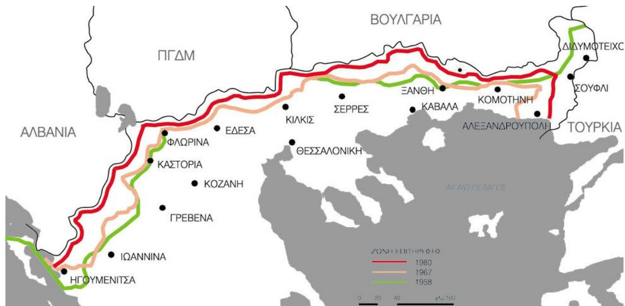
Εικόνα 2- Επιτηρούμενη Ζώνη

Η επιλογή των περιοχών όπου η Ε.Ζ. είχε μεγαλύτερο βάθος δεν ήταν τυχαία αλλά προϊόν μιας αυταπόδεικτα αρνητικής σχέσης των μειονοτήτων με την άμυνα της χώρας 12 . Σε δεύτερη φάση επομένως, ο ρόλος της Ε.Ζ. γίνεται τελικά πολιτικός, προκειμένου να υπάρχει έλεγχος του μειονοτικού πληθυσμού που ζούσε εντός της Ε.Ζ. και οικονομική εκμετάλλευση της περιοχής.