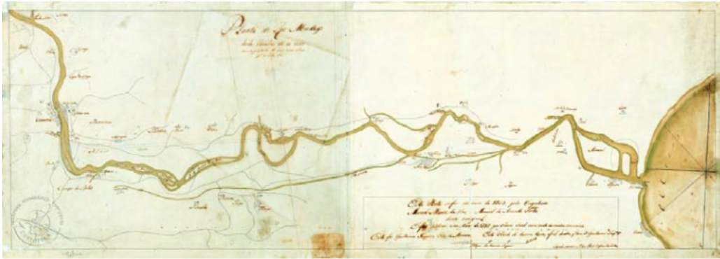
“Planta do Rio Mondego desde Coimbra até ao Mar com projecto de um novo álveo para o dito rio - 1703” Cópia do original