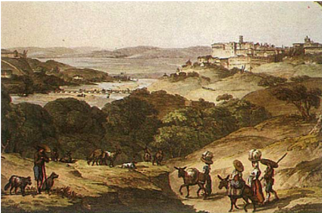
Urbe Conimbricense, ao começar o século XIX vendo-se a ponte de pedra, no Mondego assoreado Thomas St. Clair e Charles Turner, Londres, 1815