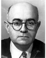
Th. Adorno (1903-1969)