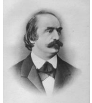
Eduard Hanslick (1825-1904)