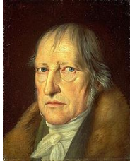
G. W. F. Hegel (1770-1831)