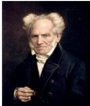
Arthur Schopenhauer (1788-1860)