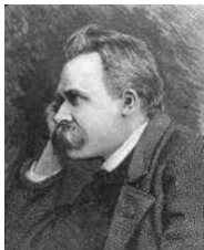
Friedrich Nietzsche (1844-1900)