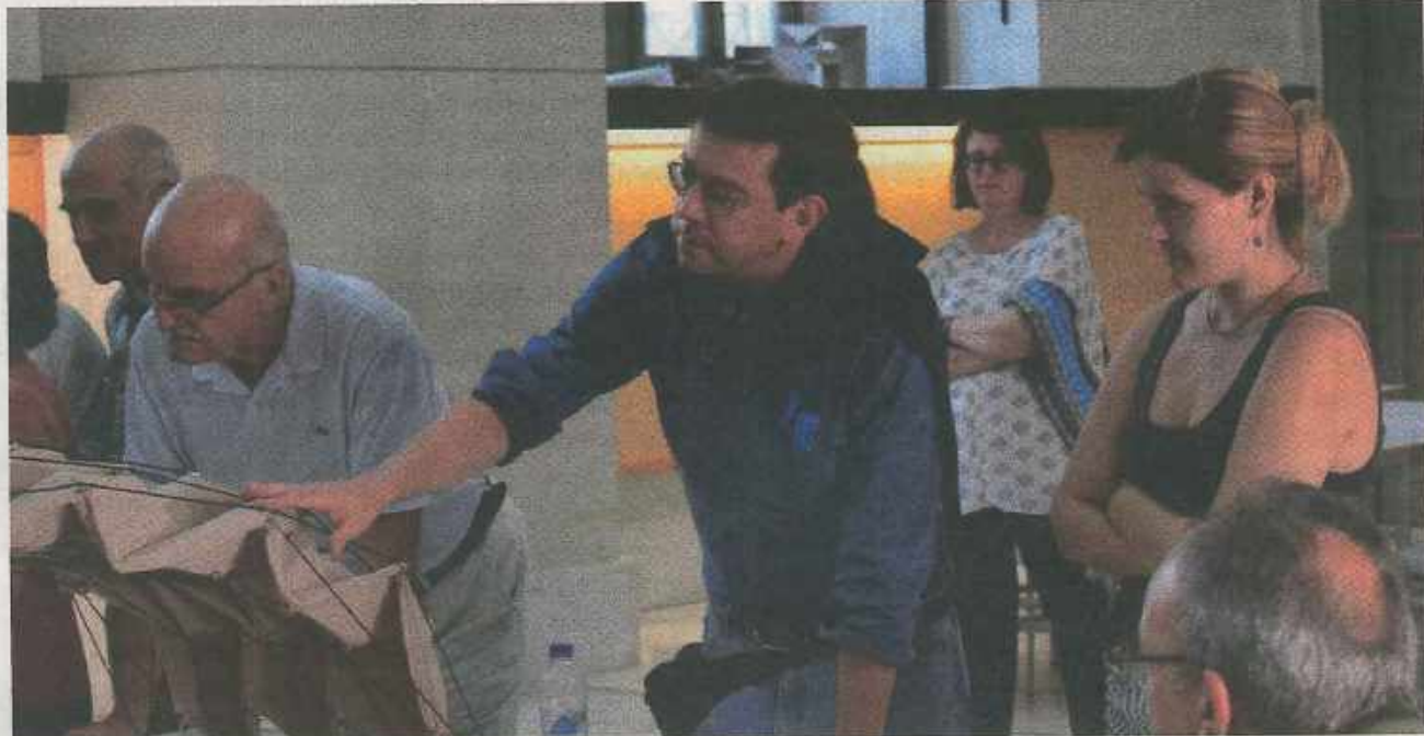
Μάθημα διά ζώσης στο εργαστήριο.

Η θεωρία μέσα στο Πανεπιστήμιο οφείλει να συνοδεύεται πάντοτε από μία ανεξάλειπτη κριτική διάθεση και