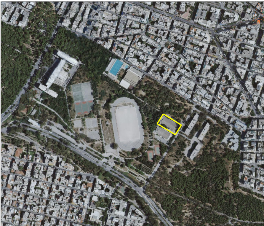
ΕΥΡΥΤΕΡΟ ΤΟΠΟΓΡΑΦΙΚΟ ΤΗΣ ΠΕΡΙΟΧΗΣ